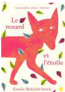
Le renard et l'étoile Coralie Bickford-Smith, Albums Gallimard Jeunesse, 2017