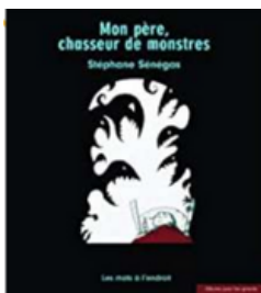
Mon père chasseur de monstres Stéphane SÉNÉGAS, 2007