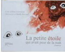
La petite étoile qui avait peur de la nuit Dan Leconteur, Persée, 2017