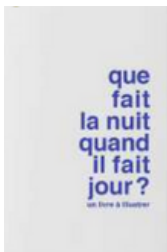
Que fait la nuit quand il fait jour ? Supereditions